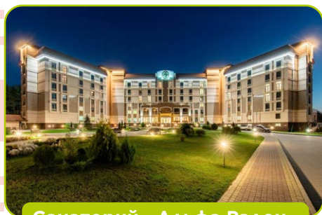
Санаторий «Альфа Радон»

Большой СПА – комплекс с открытым и закрытым бассейнами, саунами. Большой диагностический центр с полным комплексом обследования организма.