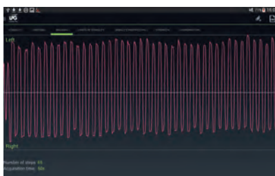
■ ТЕСТ НА ХОДЬБУ (ФУКУДА)