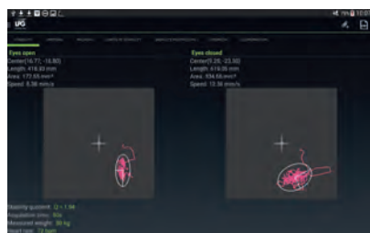
■ ТЕСТ НА СТАБИЛЬНОСТЬ (РОМБЕРГ)