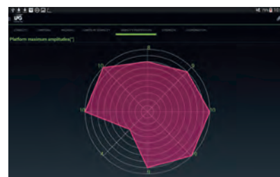
■ ТЕСТ НА ОГРАНИЧЕНИЯ ПОДВИЖНОСТИ