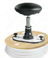
Подставки для ног